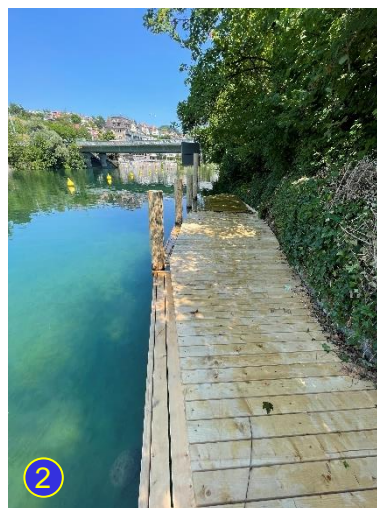
2. Ausstieg oberhalb Kahnrampe