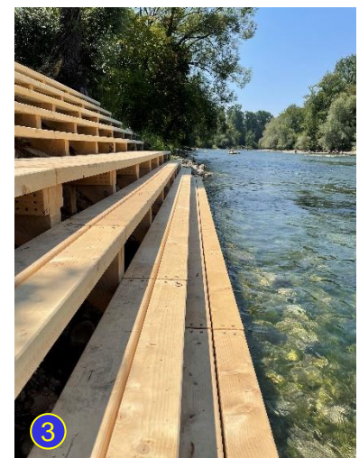
Einstieg unterhalb des Wehres