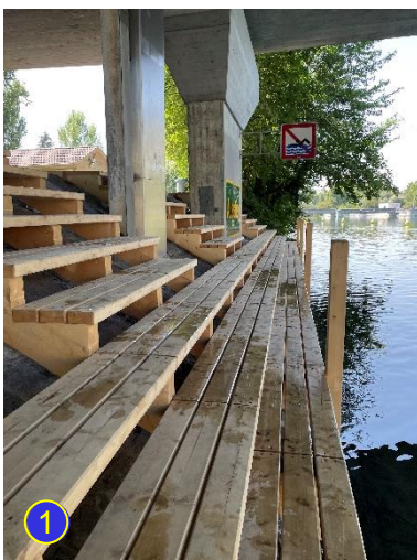
1. Ausstieg unterhalb Europabrücke