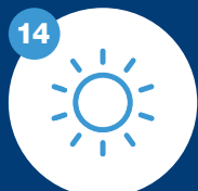
Was sind deine ganz persönlichen Vorzüge?