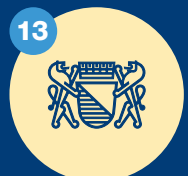
Arbeitgeberin Stadt Zürich